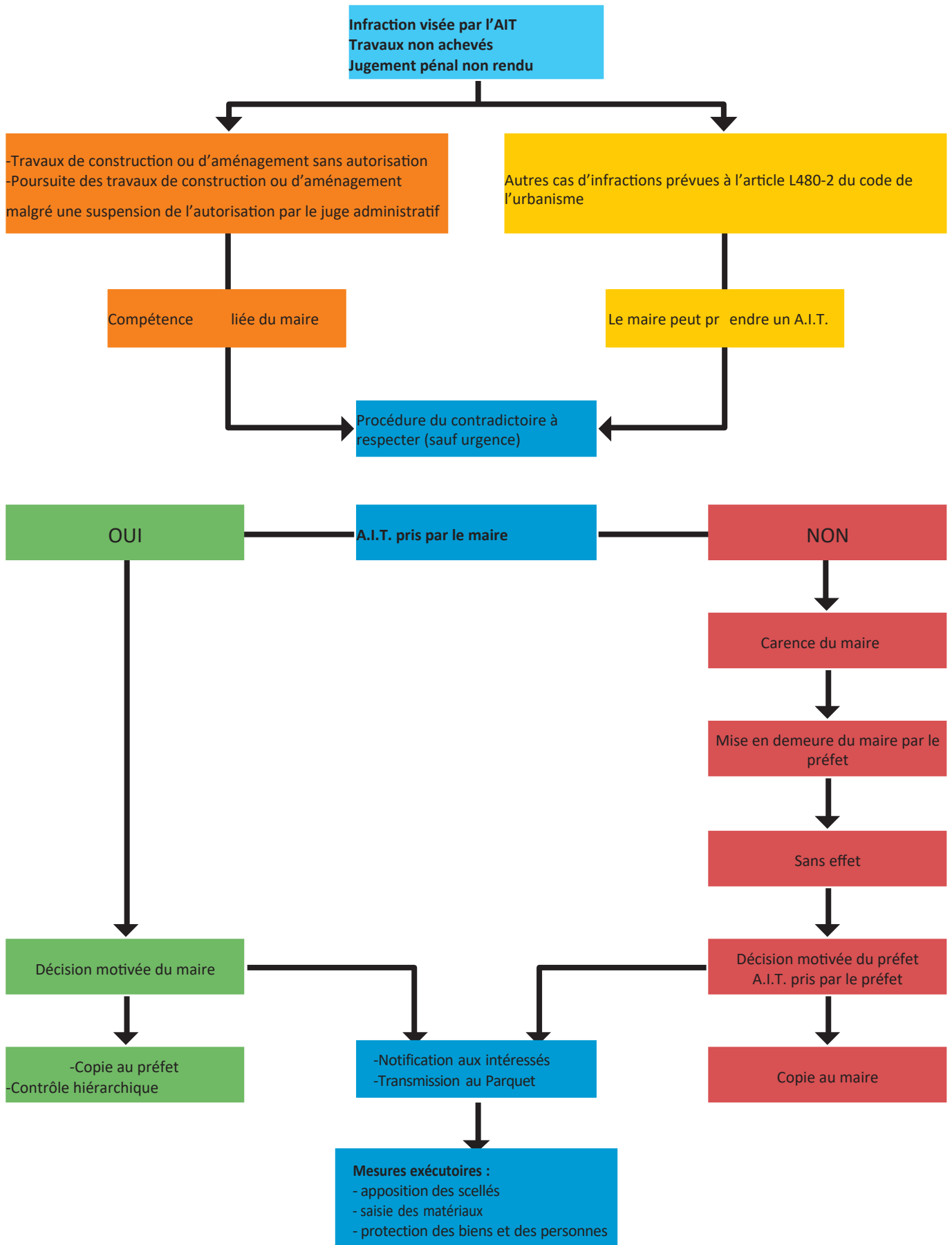
SCHÉMA DE L'ARRÊTÉ INTERRUPTIF DE TRAVAUX (A.I.T.)

Elle suit la phase administrative et constitue son prolongement répressif